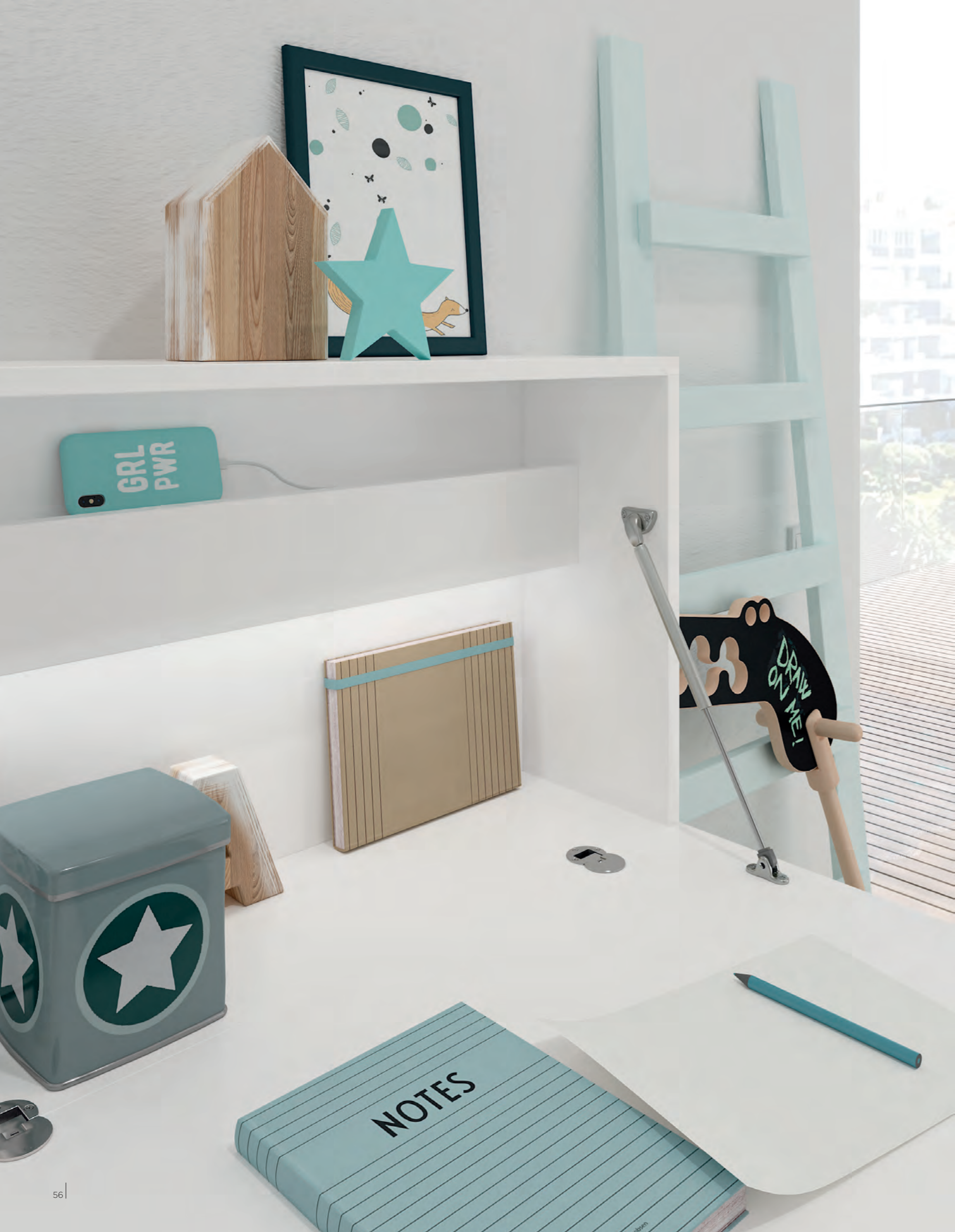
the smart flat