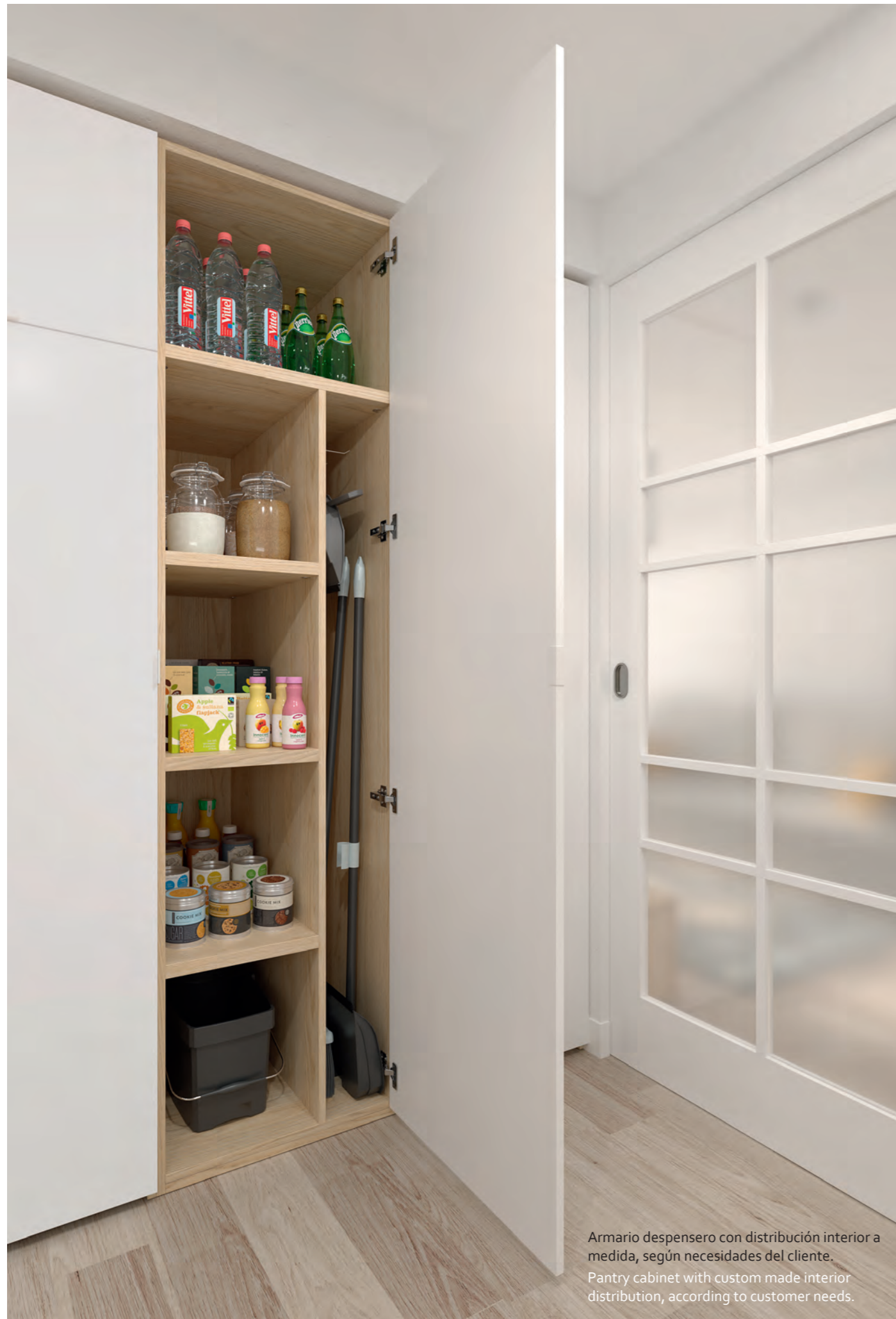
Armario despensero con distribución interior a medida, según necesidades del cliente. Pantry cabinet with custom made interior distribution, according to customer needs.