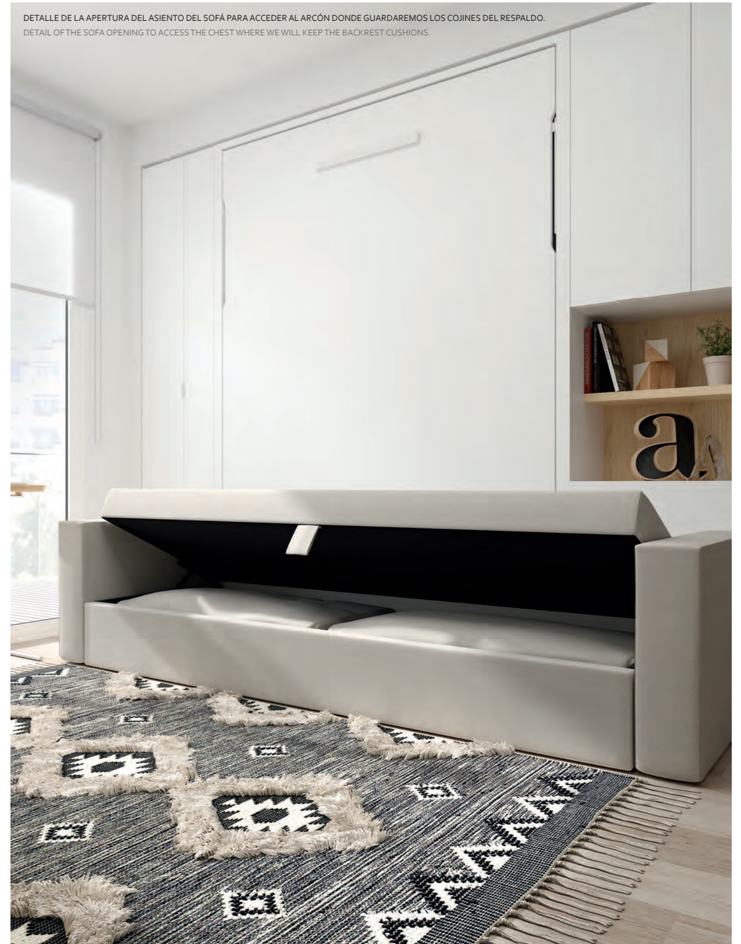
DETALLE DE LA APERTURA DEL ASIENTO DEL SOFÁ PARA ACCEDER AL ARCÓN DONDE GUARDAREMOS LOS COJINES DEL RESPALDO. DETAIL OF THE SOFA OPENING TO ACCESS THE CHEST WHERE WE WILL KEEP THE BACKREST CUSHIONS.

In front of the composition of the television, completing the living room, we locate the sofa and, in this case, we choose the longest version so that at least four people can sit. Due to its dimensions, it exceeds the size of the front panel of the bed, which would nullify access to the furniture that is behind. To solve it, from tegar, we propose to place behind the arm of the sofa an unequal door wardrobe that we will access by opening only the widest one that is free.