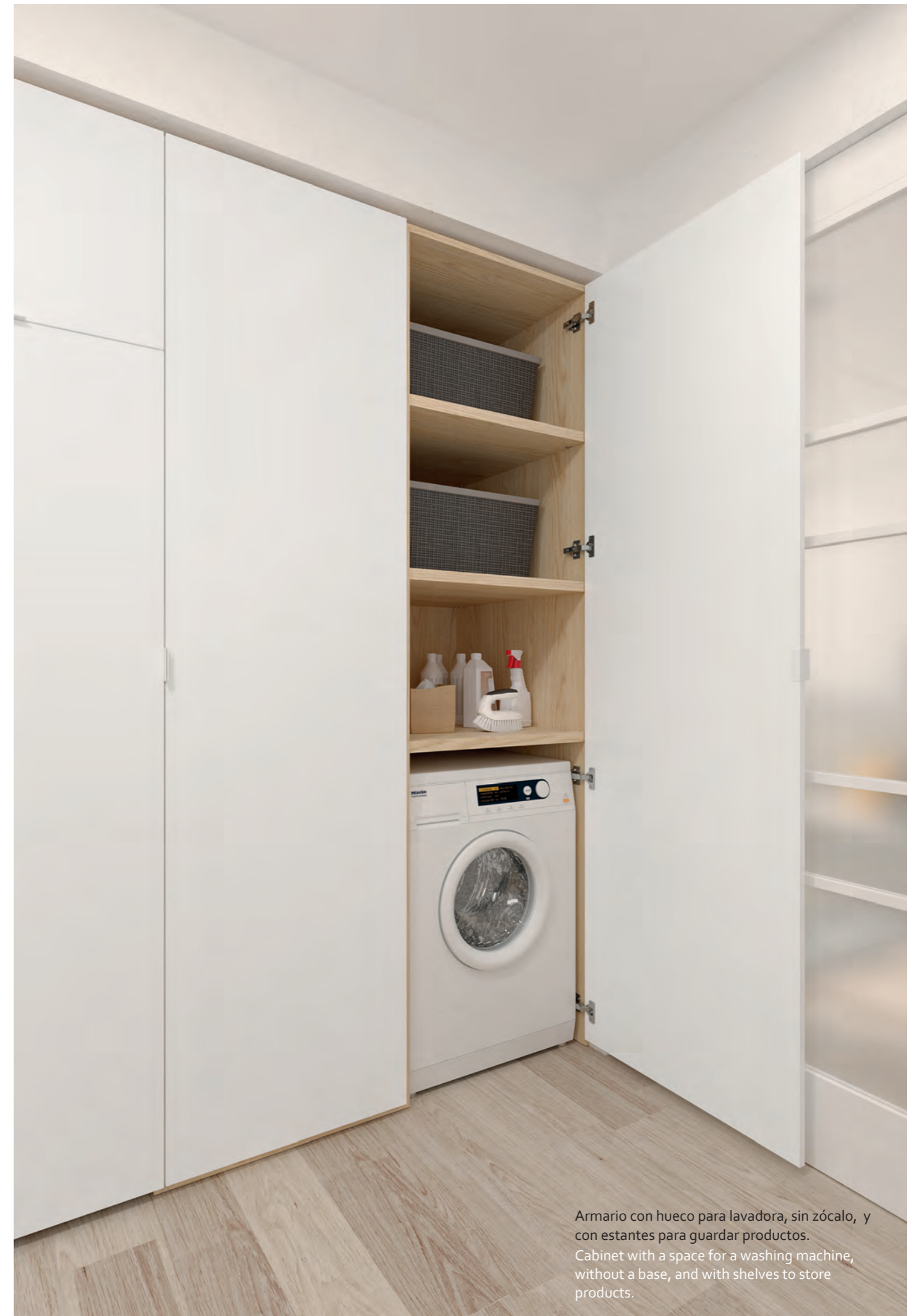
Armario con hueco para lavadora, sin zócalo, y con estantes para guardar productos. Cabinet with a space for a washing machine, without a base, and with shelves to store products.