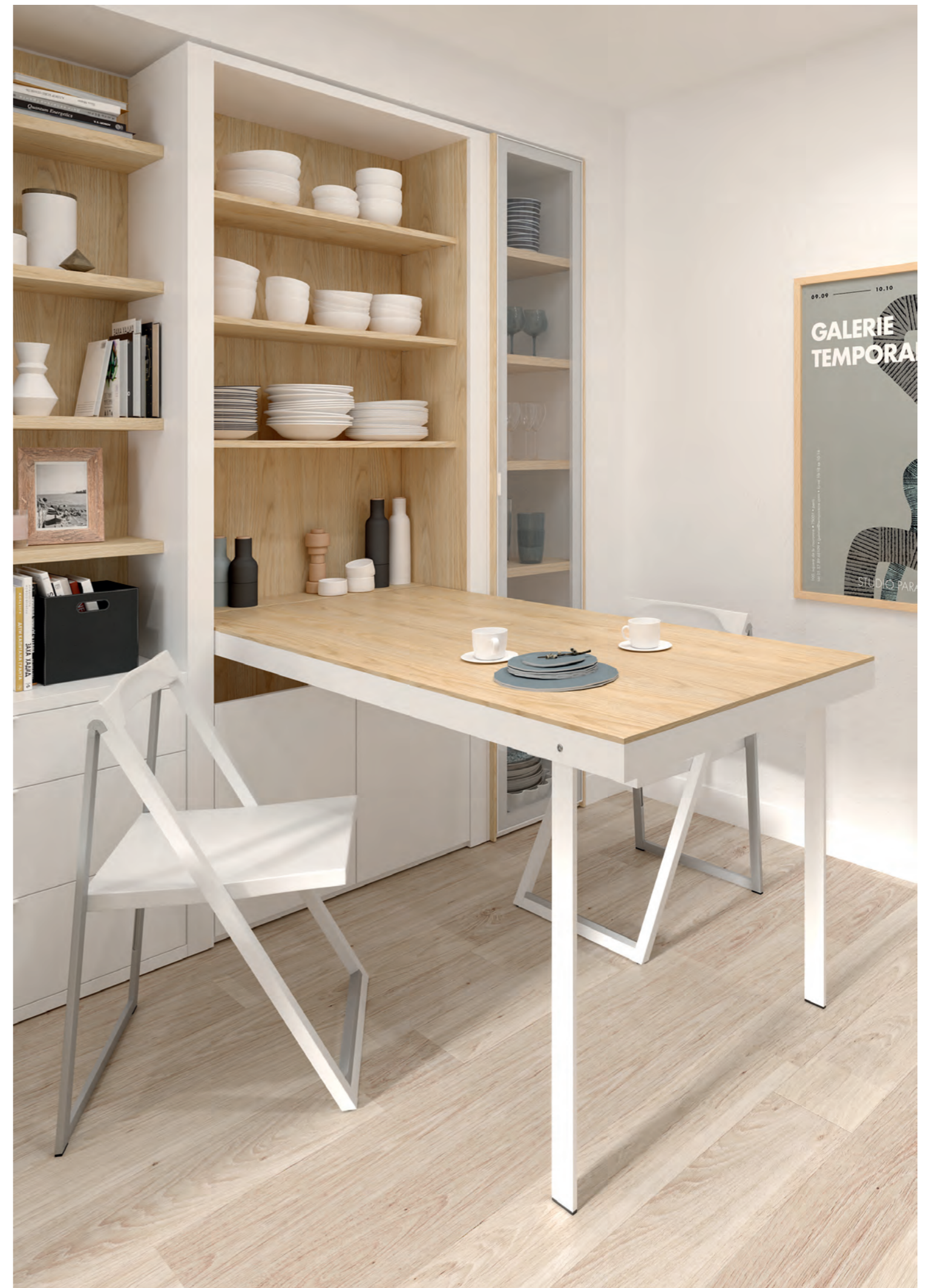
"MESA ABATIBLE DE 80 CM. CON SISTEMA AMORTIGUADO DE APERTURA CON PISTONES HIDRÁULICOS OCULTOS" "FOLDING TABLE OF 80 CM. WITH DAMPERED OPENING SYSTEM WITH HIDDEN HYDRAULIC PISTONS"

The folding tables solve the problems of lack of space since, with a damped opening system with hidden hydraulic pistons, we can easily enjoy all the benefits of a dining table and leave it collected with the same ease. In addition, they have a large storage capacity that allows us to have all the necessary items at hand to enjoy a good meal.