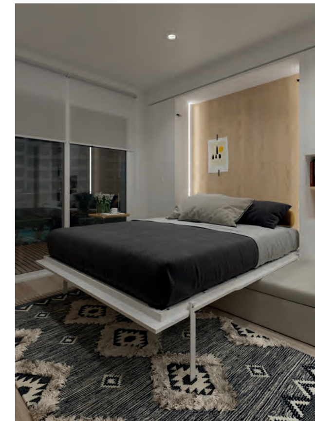
“DETALLE DE LA TIRA CON LUZ LED OPCIONAL PARA CAMA ABATIBLE VERTICAL” “DETAIL OF THE LED LIGHT STRIP, OPTIONAL, FOR VERTICAL FOLDING BED”

To lower the vertical folding bed, we will keep the backrest cushions inside the chest under the sofa seat. The metal frame of the bed and the legs are available in white and carbon finish.